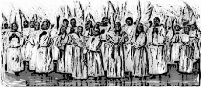
THEN 1-NA: THLÎR LÂWKNA